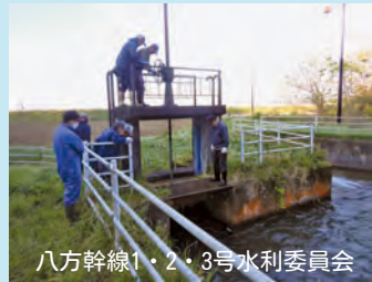
八方幹線1・2・3号水利委員会