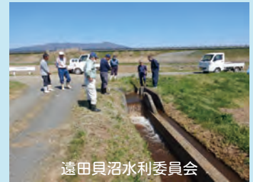
遠田貝沼水利委員会

少雪の影響が懸念されましたが、ほぼ例年同量を通水することができました。水利委員会の皆様、早朝よりご協力ありがとうございました。