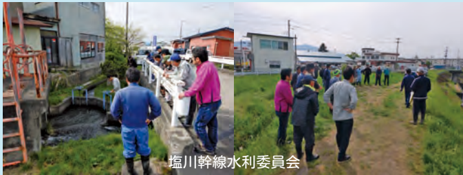
塩川幹線水利委員会