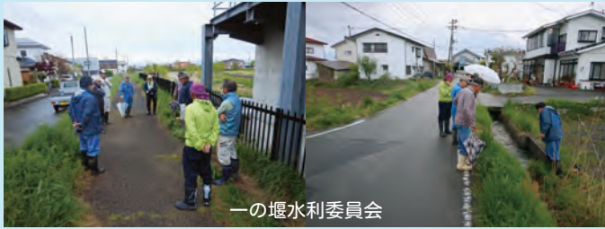
一の堰水利委員会

例年、代かき用水の最大量通水に合わせて各地域の水利委員会の立会のもと、流量の調整を実施しています。