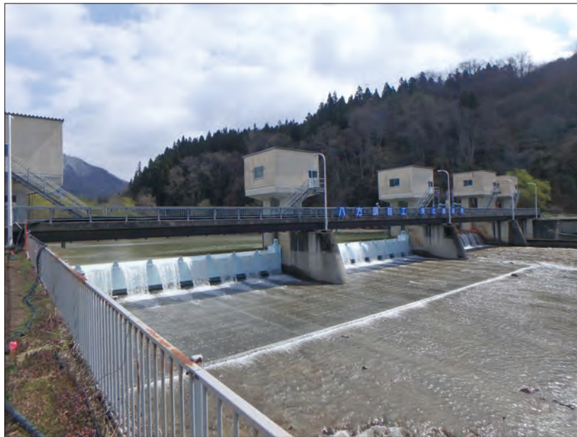
△令和元年度 長寿命化対策工事