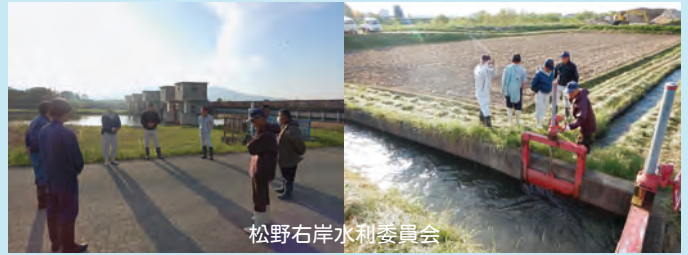
松野右岸水利委員会