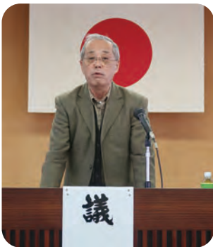
議長を務められた江花総代