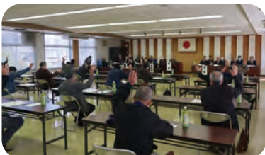
審議・採決の様子