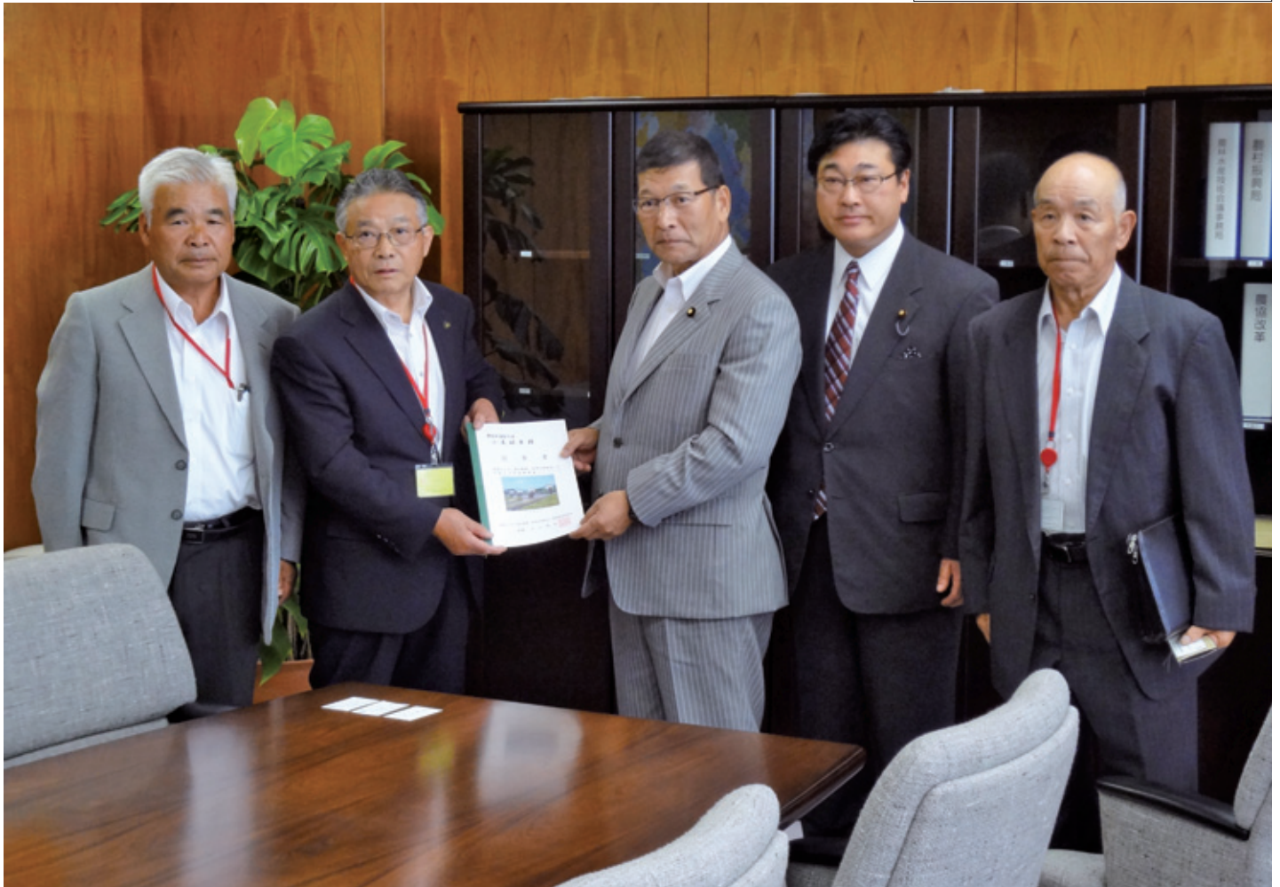
【 小泉昭男農林水産副大臣への要望活動 】

平成28年2月10日 発行所 〒966-0017 喜多方市関柴町三津井 字前田454-1 会津北部土地改良区 ☎ 0241-22-7356(代) FAX 0241-22-7396 URL http://www.aizuhokubu.or.jp E-mail info@aizuhokubu.or.jp