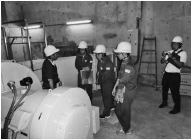
会津若松市立湊中学校の3年生の生徒3名が再生可能エネルギーに関する学習のため、土地改良区で管理している大平沼発電所の見学に来区されました。

なお、同意徴集に関しては、平成28年4月から各地区の連絡協力員の方にお願ひしますので組合員の皆様のご理解とご協力をお願い申し上げます。