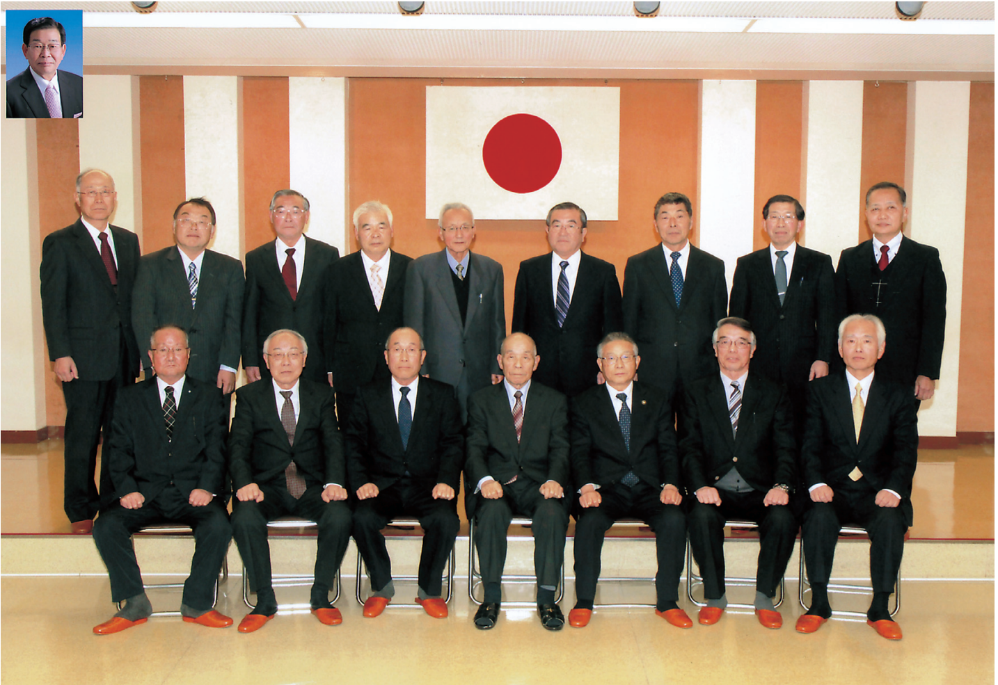
【 第11期 会津北部土地改良区役員 】

平成29年3月1日 発行所 〒966-0017 喜多方市関柴町三津井 字前田454-1 会津北部土地改良区 ☎ 0241-22-7356(代) FAX 0241-22-7396 URL http://www.aizuhokubu.or.jp E-mail info@aizuhokubu.or.jp